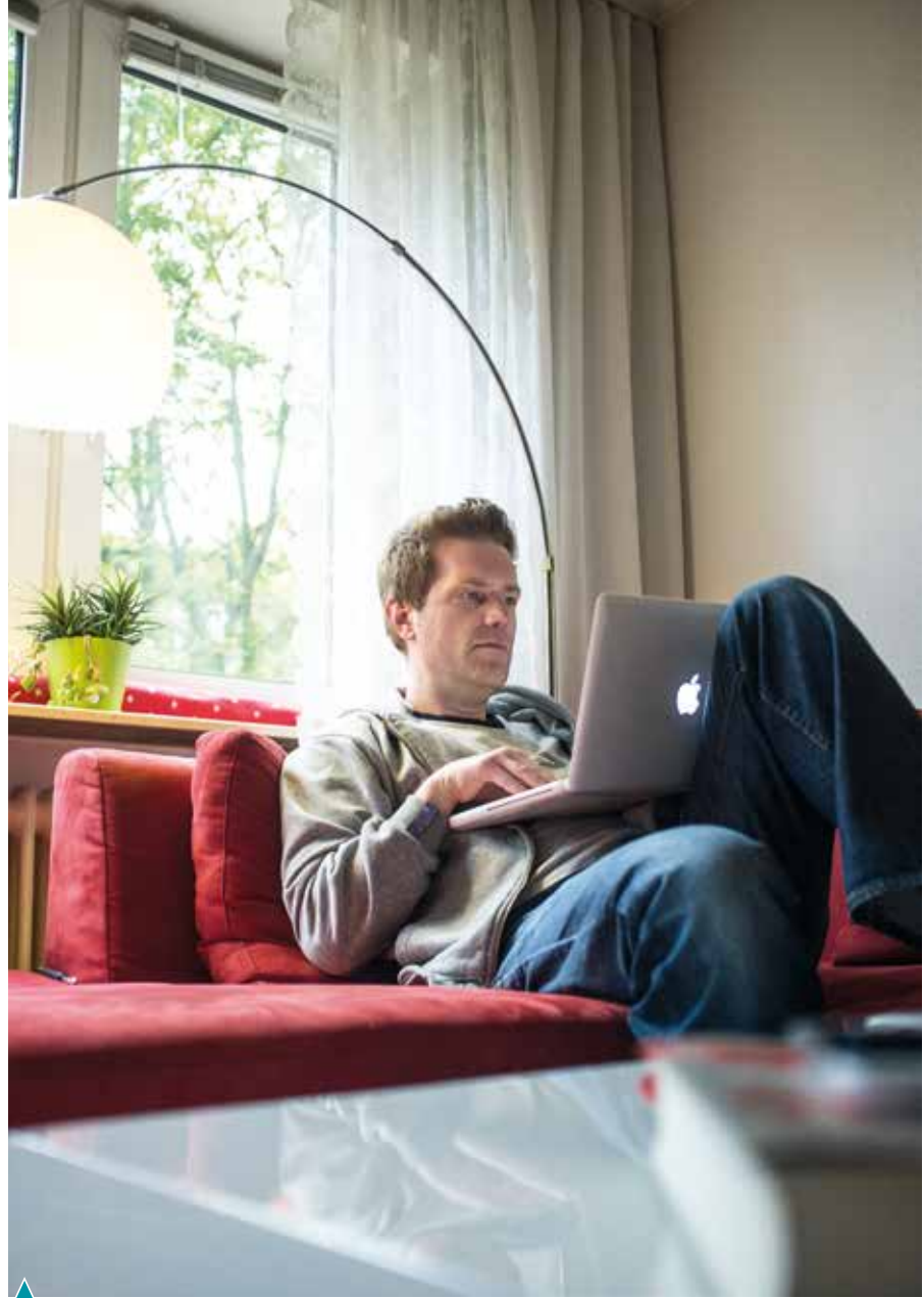
„Werde ich mich wiedererkennen?“ 128 Fragen beantwortete unser Autor für sein persönliches Reiss Profile.